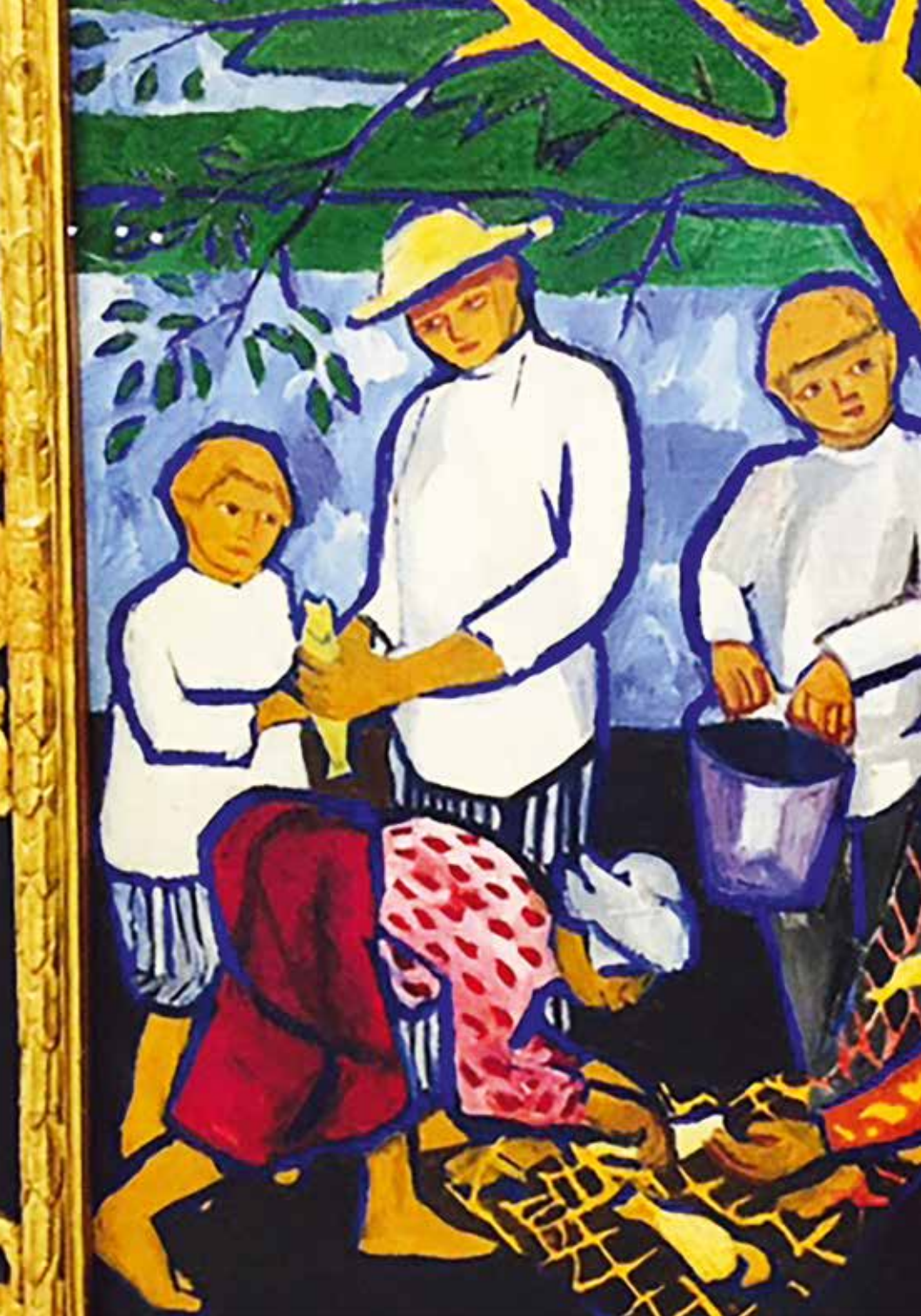
Natalia Sergueïevna Gontcharova