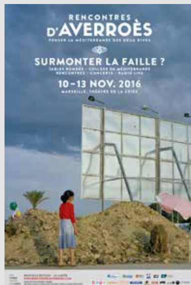
10_Affiche des Rencontres d'Averroës Graphisme Petroff Studio. Photographie © Hicham Gardaf.