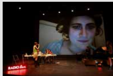
7_Radio Live-2 Radio Live : une émission de radio en trois dimensions imaginée par Aurélie Charon et Caroline Gillet